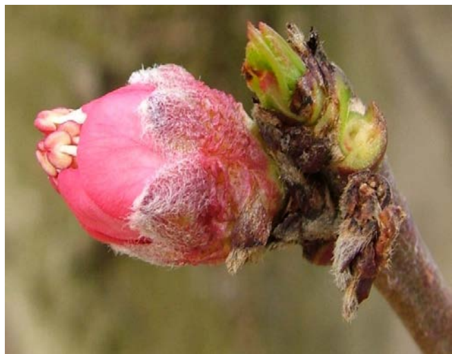
E Εμφάνιση στημόνων