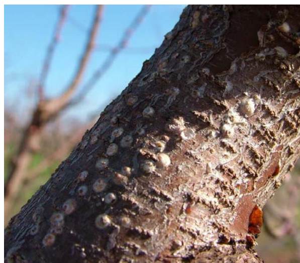
Παρουσία ασπιδίων βαμβακάδας στο 25%