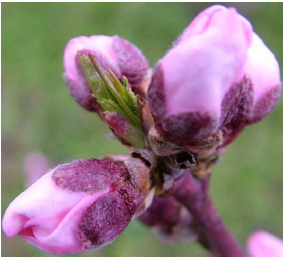
D Εμφάνιση στεφάνης