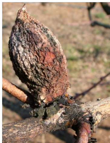
Προσβολή από Μονίλια